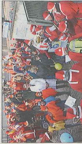
Il saluto del direttore del reparto Con le note della Street Band Mp4