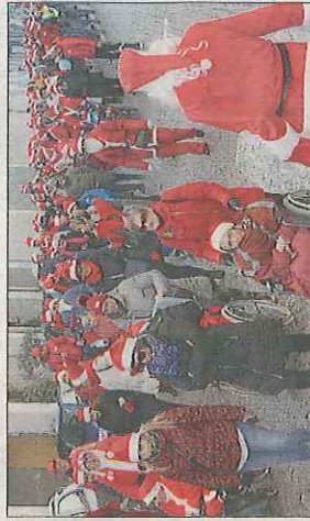
La sfilata per la città Con i nonnini e i loro walking leader

ta, Book Service e Advanced Distribution che hanno contribuito con dei doni. Infine grazie ai partecipanti e agli organizzatori della camminata solidale promossa dal Comune».