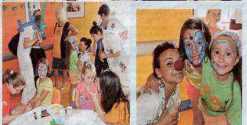
La festa si anima con giochi e sedute di trucco

umanità. La festa si anima con giochi di prestigio, canti, balli, sedute di trucco: ogni faccino ha una farfallina variopinta, una mascherina, un fiore colorato, si trasforma e brilla. Verso le 16.30 il dottor Brach del Prever si assenta un attimo per riapparire subito dopo con due Carabinieri in divisa.