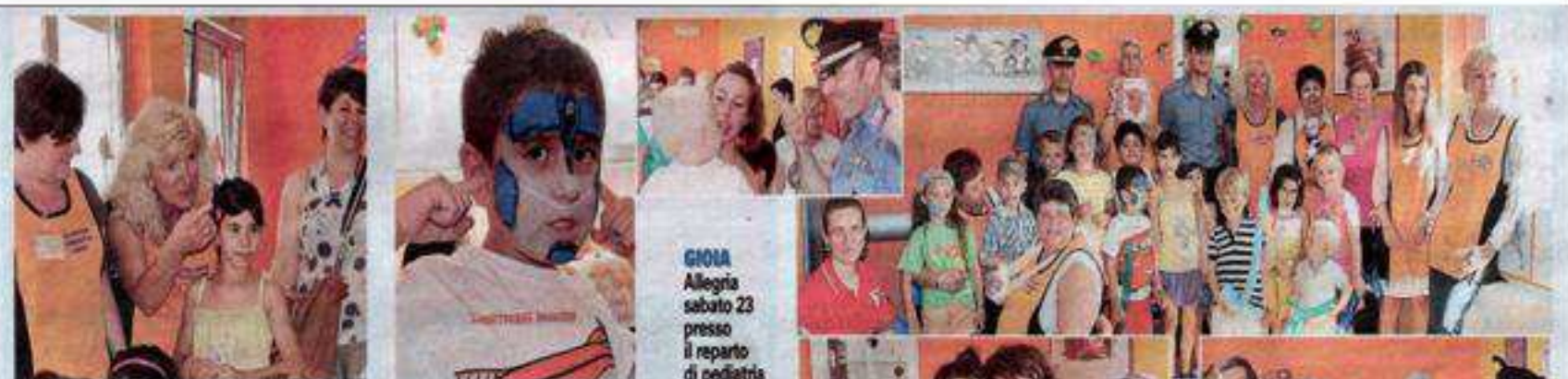
GIOLA Allegria sabato 23 presso il reparto di pediatria